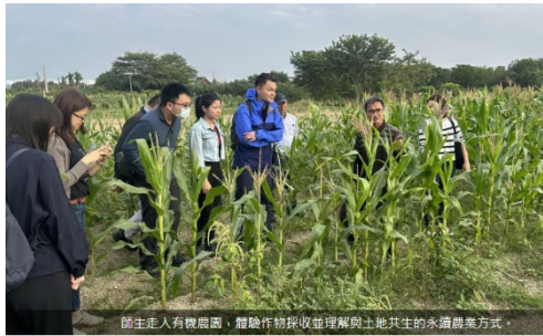
師生走入有機農園，體驗作物採收並理解與土地共生的永續農業方式。

面對人口負成長、城鄉發展失衡等結構性挑戰，「地方創生」已成為臺灣重要的公共政策關鍵字。隨著政策推動邁入地方創生 3.0 階段，如何在產業發展、環境永續與地方治理之間取得平衡，更成為各界關注的核心議題。郭瑞坤老師透過「企業永續與地方創生」共學計畫，12/6 帶領學生走出教室，前往臺南七股與高雄梓官實地踏查。 【閱讀全文】